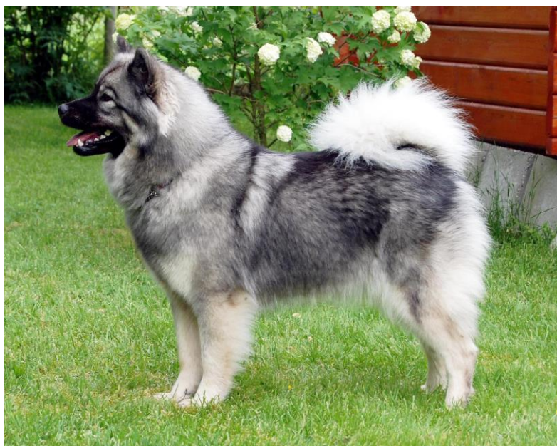
Bild på tik med utmärkt rygg och manke.