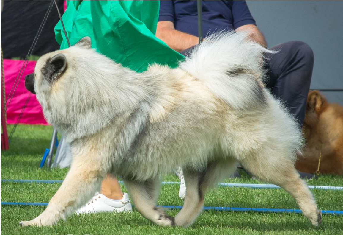
Bild på tik i rörelse med bra påskjut.

Rörelserna skall vara vägvinnande och harmoniska med god steglängd fram och kraftigt påskjut. Ryggen skall under rörelse vara fast och i god balans. Fram- och bakbenen skall röra sig rakt men rör sig närmare varandra när farten ökar. Trav är den gångart som föredras.