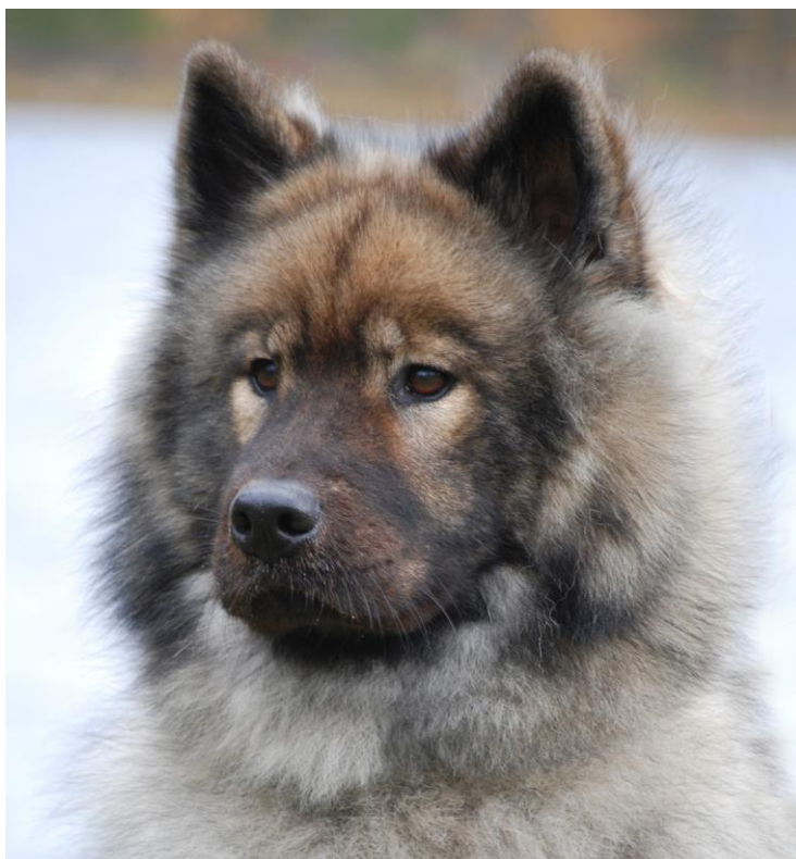
Bild av tik med välplacerade öron samt välmusklad hals.

Halsen skall vara medellång, väl musklad och harmoniera med helheten. Halsskinnet skall vara stramt åtliggande. Halsen skall mjukt övergå i kroppen.