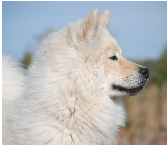
Bild på en skalle med ett korrekt stop.