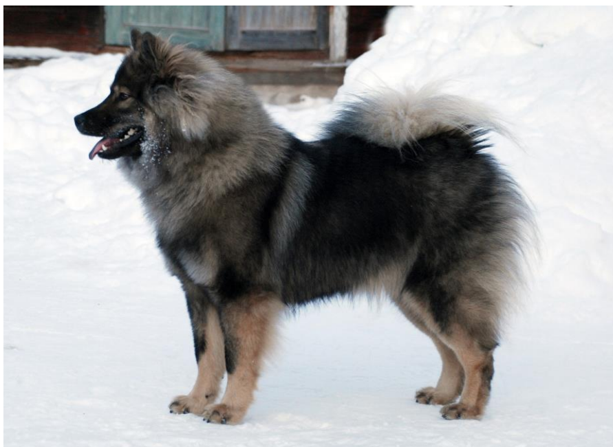
Bild på tik med bra tassar.

Baktassarna skall vara ovala, slutna och måttligt välvda. Klorna skall vara kraftiga och mörkpigmenterade. Trampdynorna skall vara hårda, tjocka och ha svart pigment. Pälsen mellan trampdynorna skall vara tjock.