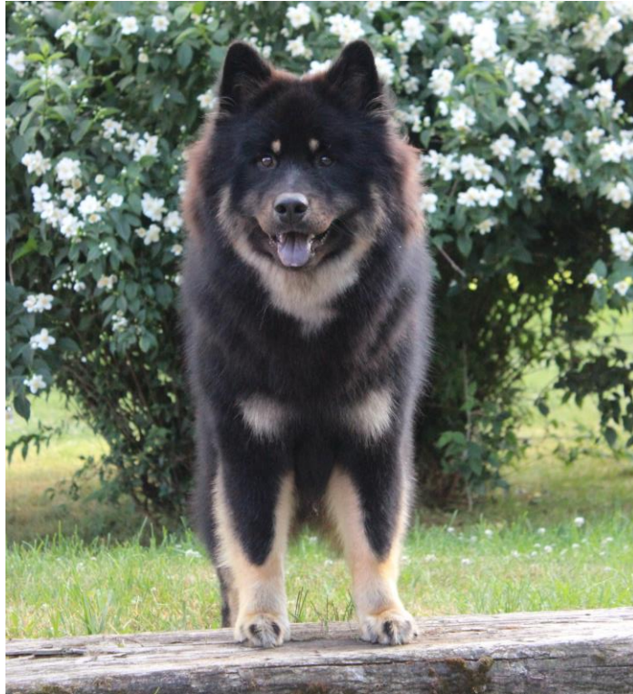
Bild på hane med ett bra framställ.