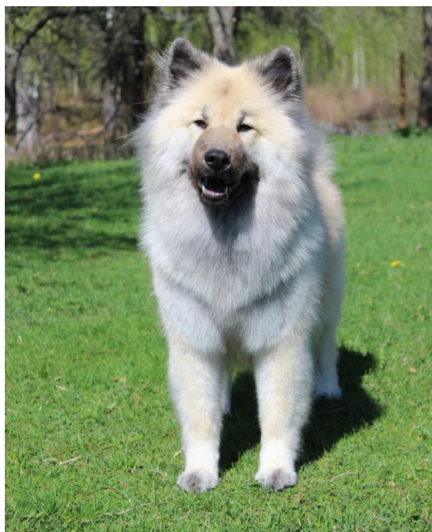
Bild på tik med parallella överarmar.

Framtassarna skall vara ovala, slutna och måttligt välvda. Klorna skall vara kraftiga och mörkpigmenterade. Trampdynorna skall vara hårda, tjocka och ha svart pigment. Pälsen mellan trampdynorna skall vara tjock.