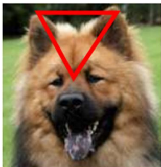
Utmärkt ansatta öron

Övertippade öron och hängöron är diskvalificerande fel. Öronen ska vara styvt uppstående med rundade spetsar.