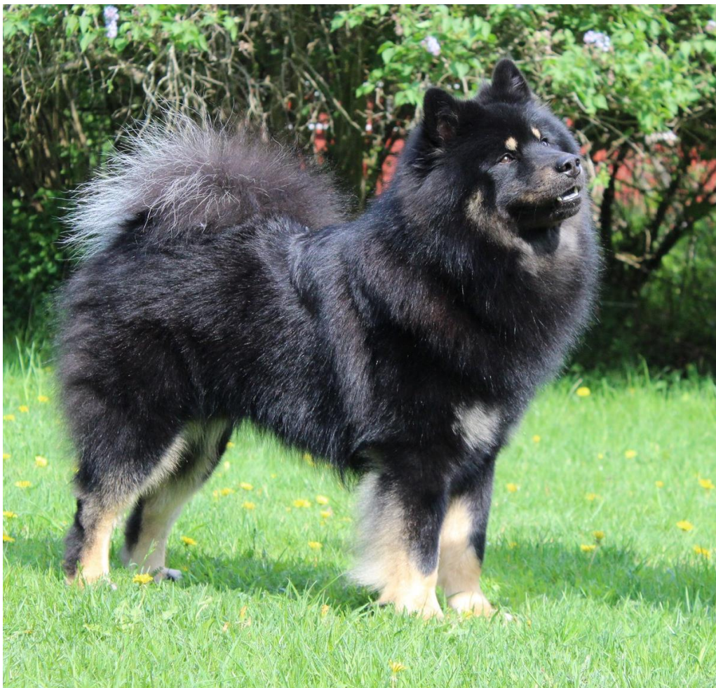
Bild på hane med balanserade proportioner.