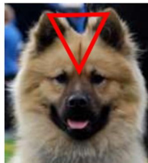
Tätt ansatta öron