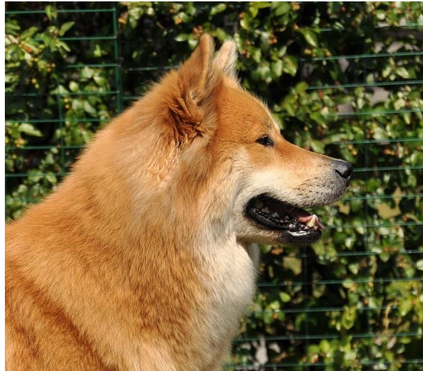
Bild på ett välformat nosparti.

Nospartiet skall varken vara för grovt eller för spetsigt. Det skall smalna av mot nostrylfeln och ha rak nosrygg och underkäke.