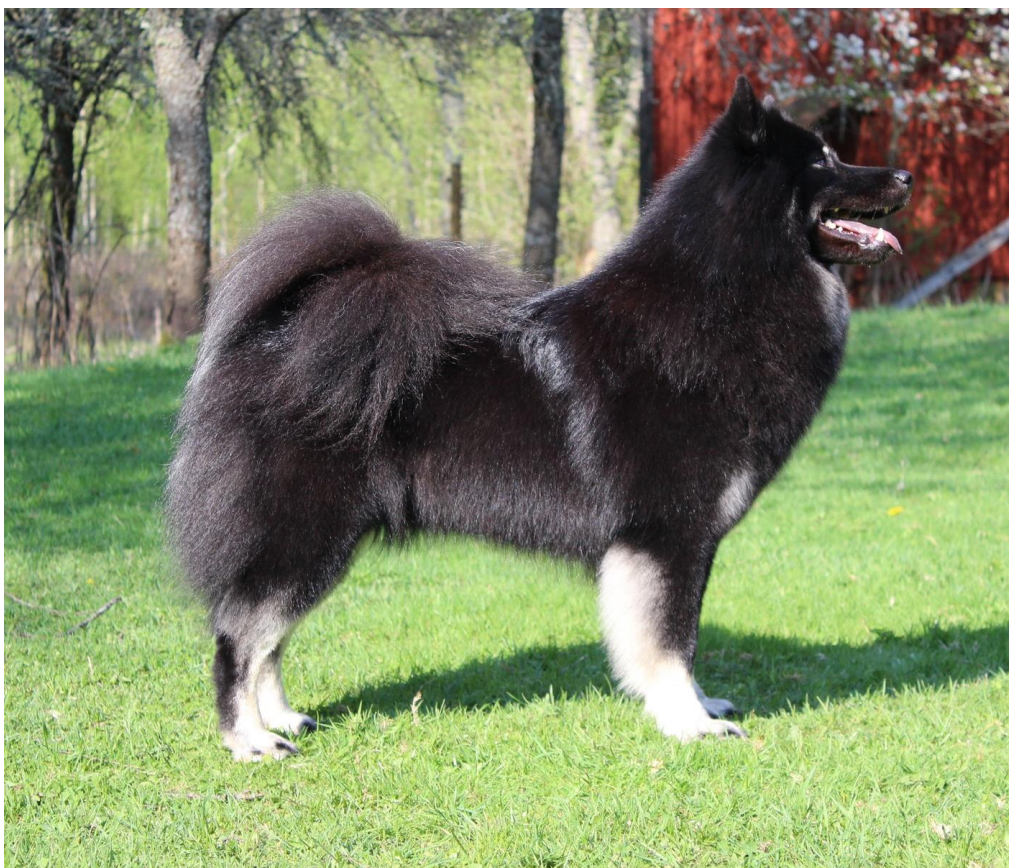
Bild på tik med utmärkt bröstkorg samt underlinje och buk.

Buklinjen skall vara lätt uppdragen och flankerna lätt indragna.