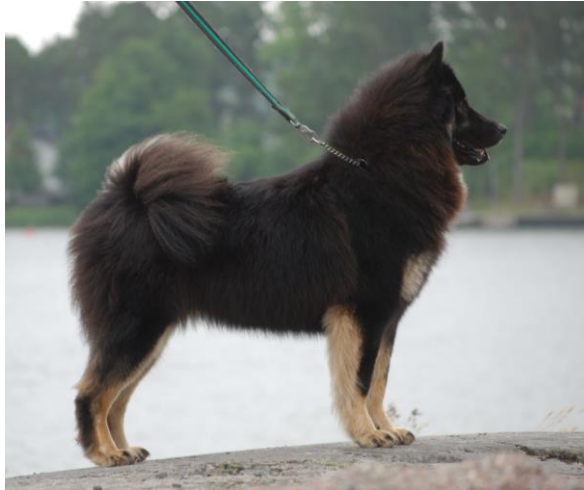
Bild av tik till vänster och hane till höger med utmärkt kropp.